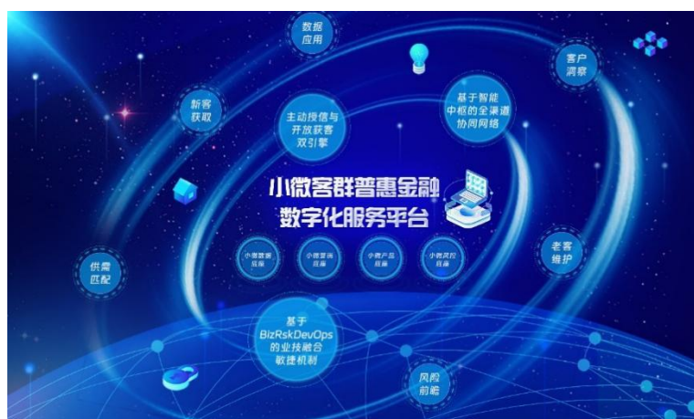
小微客群普惠金融数字化服务平台

本行以“1346”为目标，打造小微数字化金融工厂，即：“1”个小微客群普惠金融数字化服务平台；“3”大小微业务模式突破；“4”大基因转变；“6”大行业难题得到有效解决。小微客群普惠金融数字化服务平台基于场景化中台架构，以小微为纽带整合零售和公司数字化能力，构建企业级中台，以小微数据底座为基础，融合小微营销底座、小微风控底座和小微信贷产品底座，打造由“3+1”底座构成的小微数字化金融工厂。小微客群普惠金融数字化服务平台共实现 12 项技术创新，有效解决小微企业供需匹配难、客户洞察难、数据应用难等常见难题。