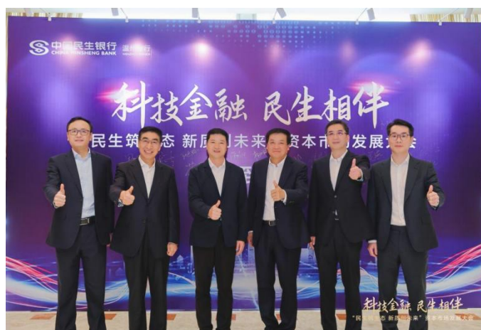
“科技金融 民生相伴”营销服务系列活动

2024 年，民生银行持续举办“科技金融 民生相伴”营销服务系列活动，旨在为科技型企业提供全生命周期的综合服务。通过与政府、园区、PE/VC 等伙伴携手，从特色产品到全景式服务，从生态渠道赋能到投融资路演，从资本市场专业辅导到支持企业产业链出海，从上海技交所到各地科技园区，从全球企业家论坛到科技型企业专利大赛，民生银行持续举办 230 余场“科技金融 民生相伴”主题营销活动，取得了较好的效果。