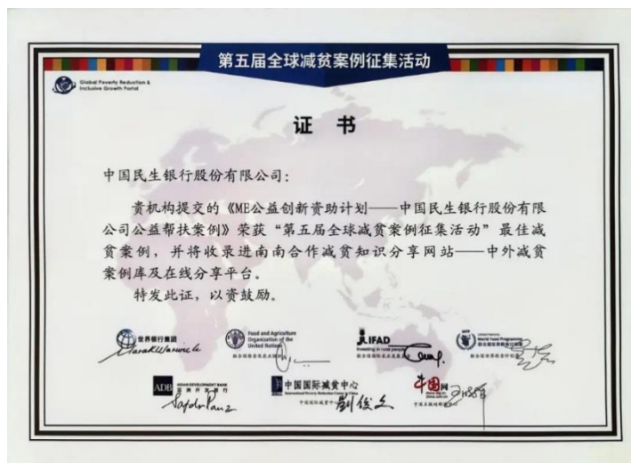
第 5 届全球减贫案例征集活动最佳案例证书

本行连续 10 年实施“我决定民生爱的力量——ME 公益创新资助计划”，累计捐赠资金 1.14 亿元，为 245 个乡村振兴、社区发展、教育支持、健康福祉、生态文明等领域的创新公益项目提供资金支持，惠及全国 31 个省、自治区、直辖市，覆盖 308 个区县的 37.4 万人。2024 年，ME 公益创新计划资助入选为全球减贫最佳案例。