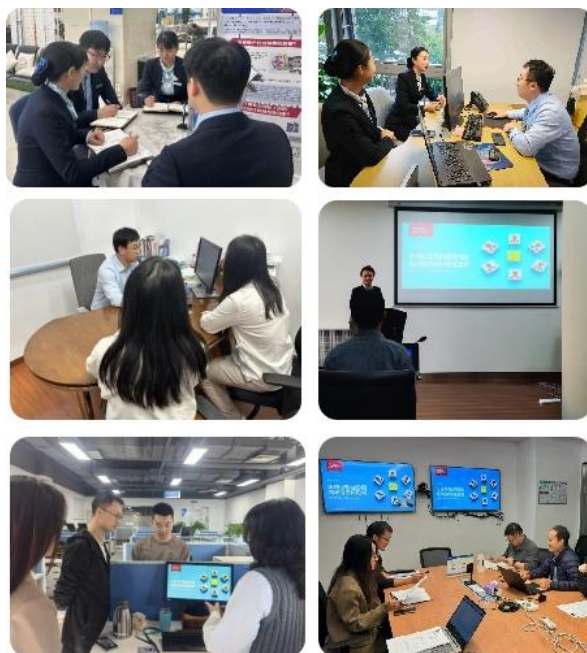
高质量管理能力提升系列培训项目

领导力与管理能力发展。 本行启动全行高质量管理能力提升系列培养项目，围绕管理重点，分层分类设计实施各层级管理能力提升计划，通过高层、中层和绩优青年员工三层协同培养，切实提升各级员工履职能力。