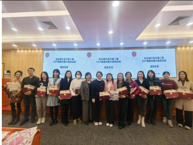
第二期“EAP 健康大使”培训班