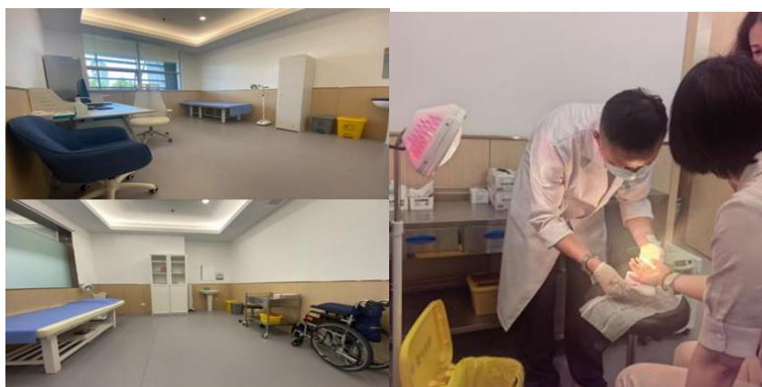
民生医务室及健康小屋为员工提供医疗健康服务

为提升员工健康管理和服务水平，营造企业健康文化，总行经西城区卫生健康委员会批准，取得《医疗机构执业许可证》并设立民生医务室及健康小屋，为员工提供包括全科咨询诊疗、慢性病管理、医疗急救、心理咨询、康复理疗、健康宣教等在内的全方位医疗健康服务。2024 年，医务室及健康小屋累计问诊量达 10,412 人次，全年提供专家巡诊服务 48 次，健康理疗服务 97 次。