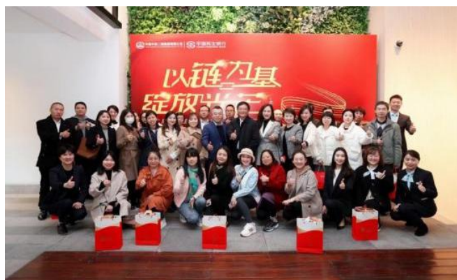
“以链为基，绽放光芒”供应链金融系列活动

本行综合应用供应链金融创新产品“信融 e”，借助互联网技术应用，通过银企直连方式，依托核心企业信用及数据增信，为其上游供应商企业提供全面、透明、快捷的电子化应收账款管理及银行低成本融资服务支持，并通过批量开户、集中放款等操作，全面提升服务效率，有效缓解客户应付账款支付压力，保障客户的付款需求及供应商的融资需求。